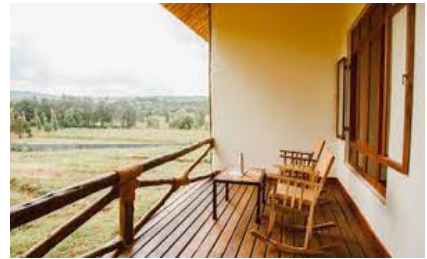
Marera Valley Lodge