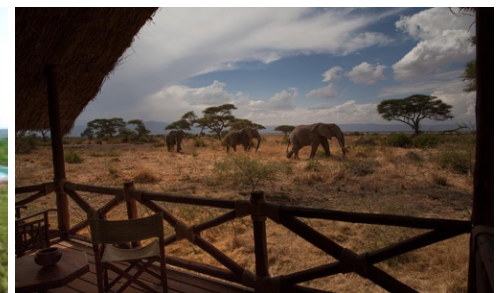
Tarangire Simba Lodge