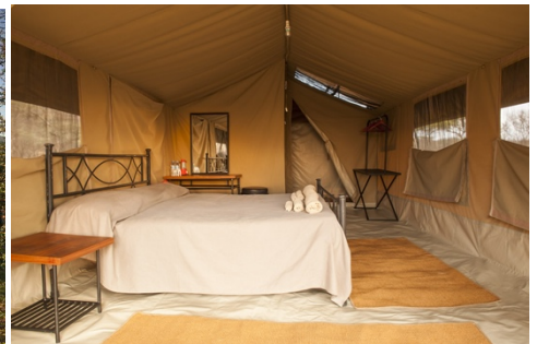
Kati Kati Tented Camp